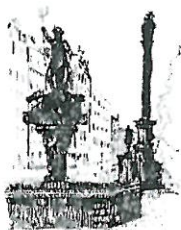
Rynek Fontanna z Neptunem